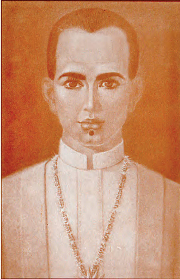
พ่อขุนรามคำแหงมหาราช พระชนมายุ ๓๕ พรรษา