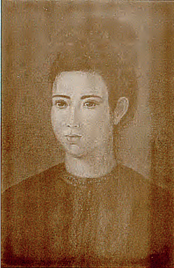
เจ้าหญิงอรัญญาณี เจ้าหญิงแห่งแสนหวีนคร พระชนมายุ ๑๘ พรรษา