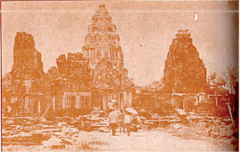
ปราสาทหินพิมาย จังหวัดนครราชสีมา