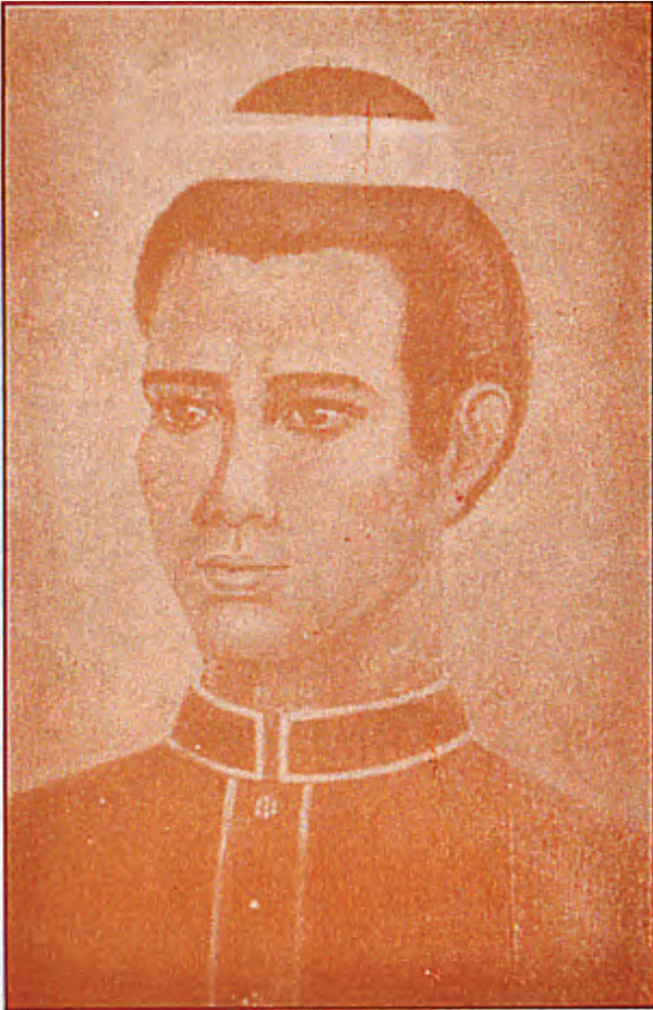
สมเด็จพระนเรศวรมหาราช พระชนมายุ ๓๖ พรรษา