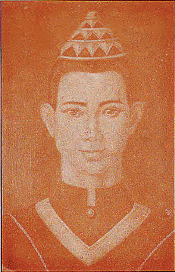
สมเด็จพระรามาธิบดีที่ ๑ (พระเจ้าอู่ทอง) พระชนมายุ ๓๖ พรรษา