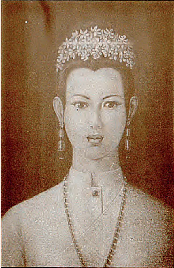
พระนางจามเทวี แห่งเขลางค์นคร พระชนมายุ ๒๕ พรรษา