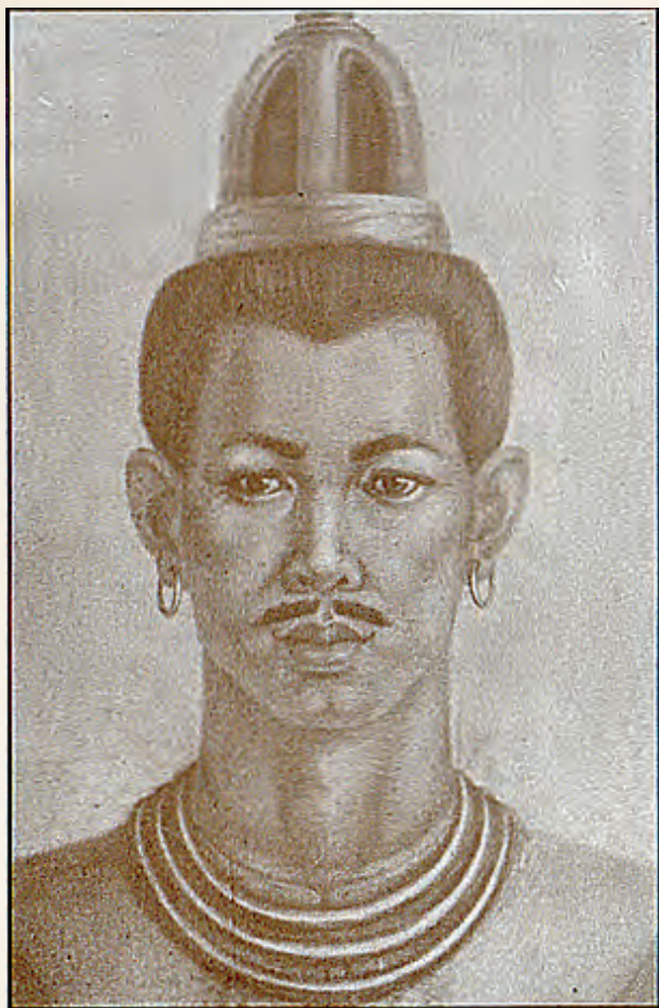
พ่อขุนผาเมือง