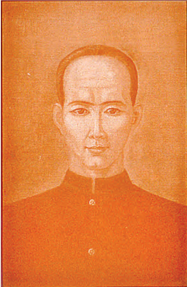
สมเด็จพระเจ้าตากสินมหาราช พระชนมายุ ๘๔ พรรษา