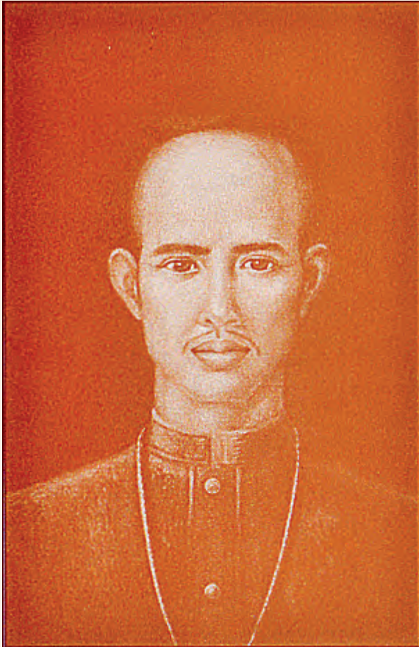
สมเด็จพระนารายณ์มหาราช พระชนมายุ ๓๖ พรรษา