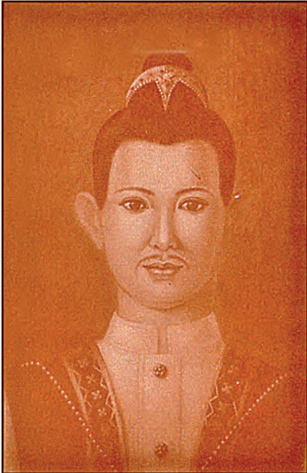
พ่อขุนเม็งรายมหาราช พระชนมายุ ๓๖ พรรษา