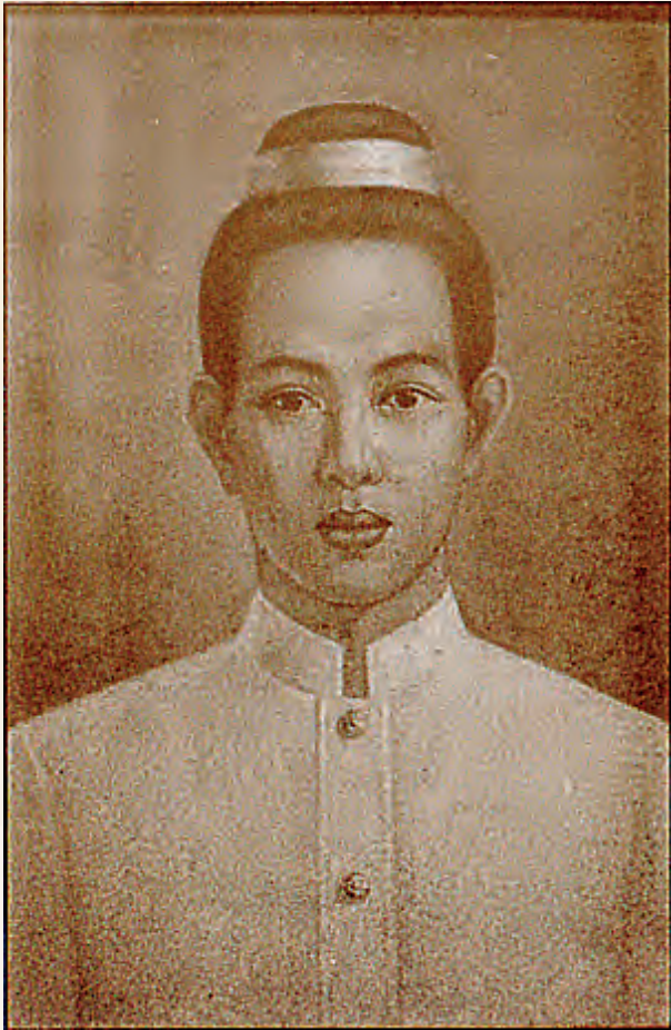
สมเด็จพระเอกาทศรถ