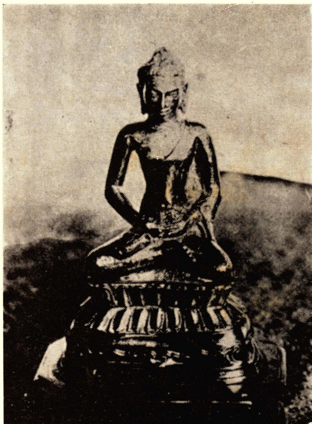
พระพุทธรูปนรินทร์ราช ทองคำ สมัยทวารวดี ปัจจุบันอยู่ในหอเสถียรธรรมปริต ในพระบรมมหาราชวัง