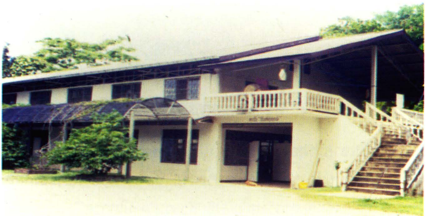
๕ หอฉันจันทร์ศุภฤกษ์

ศาลากัมมัฏฐาน พุทอัง สรณัง คัจฉามิ เป็นอาคารอเนกประสงค์ อีกหลังหนึ่ง ที่ก่อสร้างกลมกลืนกับบริเวณป่าสนมาฆบูชา เป็นอาคาร สองชั้น มีความร่มรื่นตลอดทั้งกลางวันและกลางคืน ใช้เป็นที่พักบำเพ็ญจิตภาวนา ซึ่งใช้ได้ทั้งตัวอาคารและบริเวณป่าสน