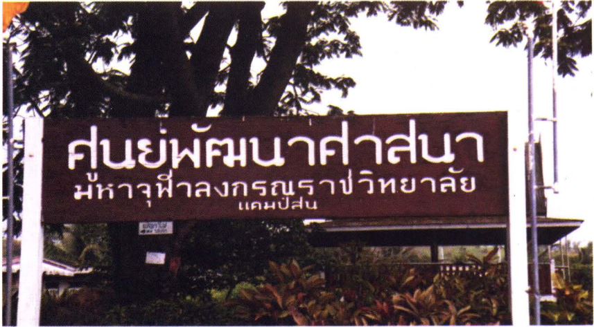
ศูนย์พัฒนาสาสนาแม่โจ้

เพื่อนบ้านที่เป็นที่รู้จักของนักท่องเที่ยวมีอยู่หลายแห่ง เช่น ไร่บีเอ็น ที่มีชื่อเสียงในการปลูกพืชเมืองหนาว อนุสรณ์ผู้เสียสละเขาค้อ ภูหินร่องกล้า ฯลฯ เป็นต้น