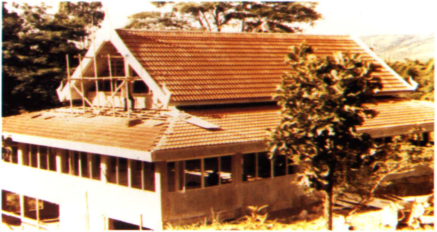
๕ ศาลากัมมัฏฐาน

ศาลากัมมัฏฐาน พุทอัง สรณัง คัจฉามิ เป็นอาคารอเนกประสงค์ อีกหลังหนึ่ง ที่ก่อสร้างกลมกลืนกับบริเวณป่าสนมาฆบูชา เป็นอาคาร สองชั้น มีความร่มรื่นตลอดทั้งกลางวันและกลางคืน ใช้เป็นที่พักบำเพ็ญจิตภาวนา ซึ่งใช้ได้ทั้งตัวอาคารและบริเวณป่าสน