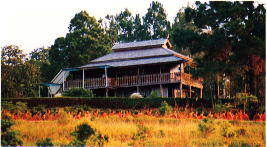
๕ กุฏิพระสังฆเถระ

เป็นเนินชಾಯอาณาเขตด้านทิศตะวันออก คนละฝั่ง สระใหญ่ กับพระเจดีย์อิสรภาพฯ ฐานของเนินนี้ตัดเป็นขั้นบันได ยอดเนินเป็น ที่ตั้งกุฏิสังฆเถระ กุฏิไม้สักทั้งหลังทรงไทยล้านนา สร้างขึ้นเป็นอนุสรณ์ ๒๕ ปีศูนย์พัฒนาศาสนาแคมป์สน