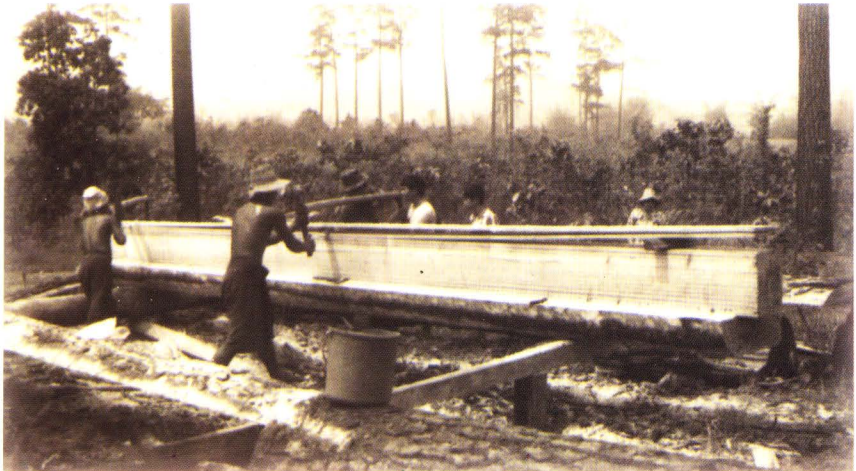
สภาพป่าถูกทำลาย

เพื่อเอาน้ำมันสน โคนและเลื่อยไม้จนดินที่เป็นป่าส่วนใหญ่มีสภาพโล่งเตียน หน้าดินถูกทำลาย เกิดความแห้งแล้งทั่วไป